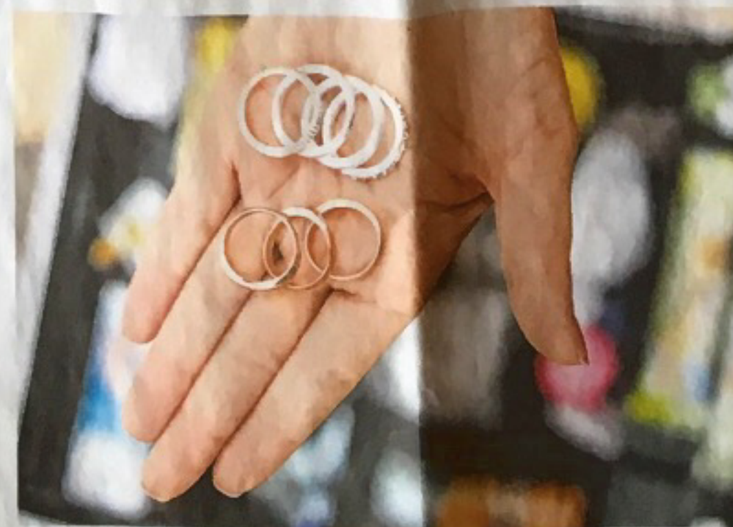
Für alle Fälle: Stefanie Frädlich hat auf jeder Hochzeit ihren Notfallkoffer dabei – unter anderem mit Ersatz-Trauringen in Gold und Silber

die Frädlich aus ihrer hellgrauen Filzmappe gezogen hat. Bei ihr fängt Planung mit der Locationsuche an; da müsse es beim Brautpaar „Klick machen“, sagt sie.