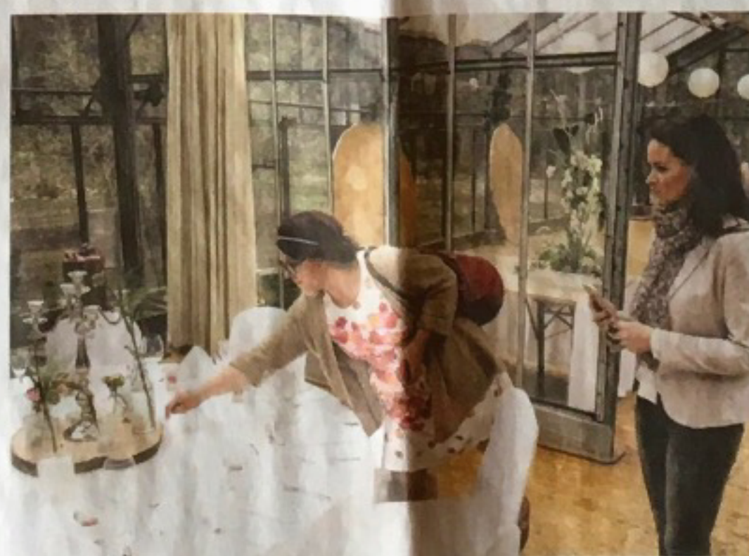
... und in die Location, das Gewächshaus des Hotels am Döllnsee. Die Tischdeko dort ähnelt ihrem Konzept, stammt aber von einer anderen Planerin